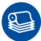
Целлюлозно- бумажная промышленность