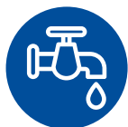
Водоснабжение и водоотведение